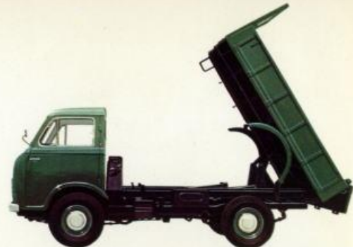
キャブオールディーゼル ダンプトラック (2トン積)