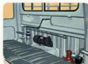
シートバック裏に工具類一式が格納されていて取出しも容易です。