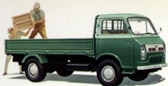
キャブオール 高床式トラック (2トン積)