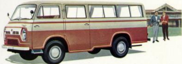
ニッサン エコ マイクロバス (24人乗・20人乗・17人乗)