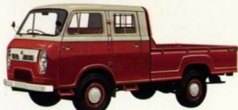
キャブオール ダブルキャブ (6人乗・2トン積)