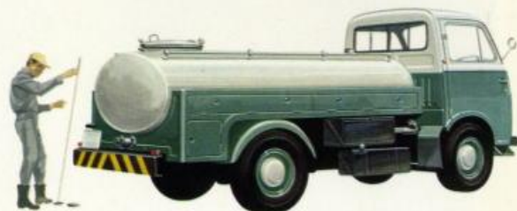
キャブオール タンクローリー (容積2000ℓ)