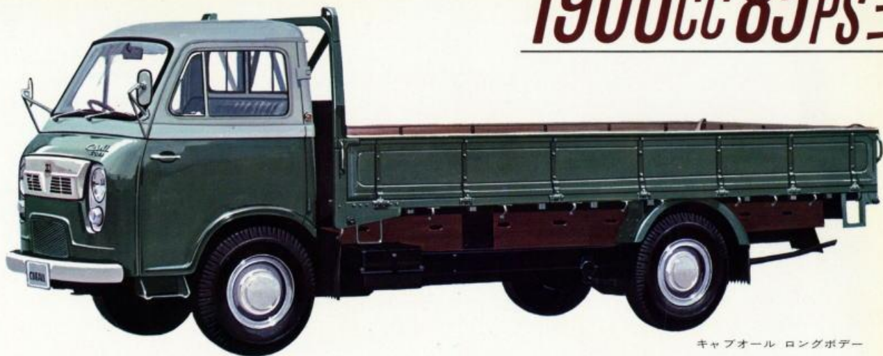
キャブオール ロングボデー

「大型車なみの輸送力」と、ご好評をいただき、使いやすく、高能率のニッサン キャブオールは、新感覚のボデーカラーやトップエンブレム、混雑した市街地でも安全なサイドマーカーランプ、充電効率の高い交流発電機などで、一段と機能美と性能を高めました。このキャブオールに、新しく、更に長く、広い荷台のロングボデーが加わりました。長尺物、家具、箱物などのかさばるものも大量輸送でき、大きな機動力を発揮します。