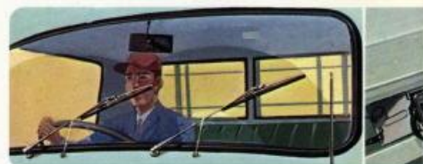
ウインドシールドウォッシャー