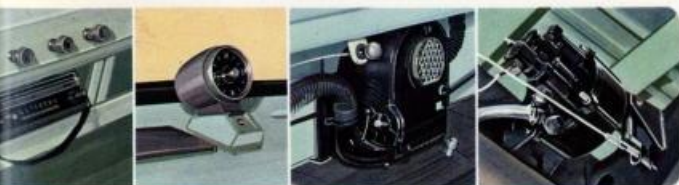
ポータブル兼用ラジオ 美しく正確な時計 高性能ヒーター ハイドロマスター

中低速で高トルクを発揮する、ねばり強いキャブオールエンジンは、F500メタルで耐久性も十分です。最大トルク15.2kgm、満載時にも余裕たっぷり、スタートに登坂に、軽快な加速が楽しめます。また高い充電効率を示す交流発電機を採用し、独自の2連式カーブレターで普通燃料でも高性能を発揮し、経済的です。