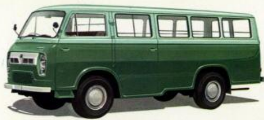
キャブオール ライトバン (3人乗・2トン積 / 6人乗・1.5トン積)